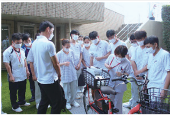
自転車の説明と乗車体験を行いました