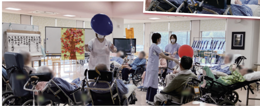
介護医療院ひいろB3療養病棟