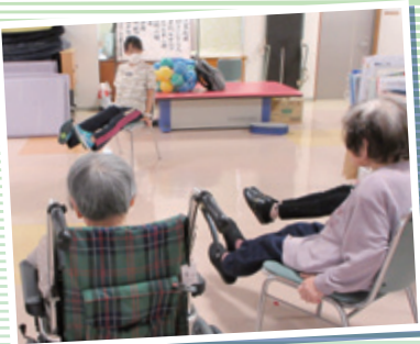
▲体操の様子 みなさん笑顔で楽しそうです

自分が楽しんで笑っていないと相手にも楽しさが伝わらないと思うので、笑って過ごすようにしています。プライベートで大変なこともあります。現場に行くとみなさんの笑顔もあって、自然と気持ちも切り替わります。