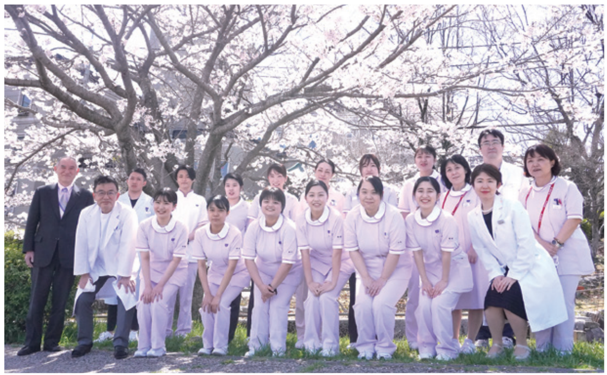
撮影時は一時的にマスクを外しました