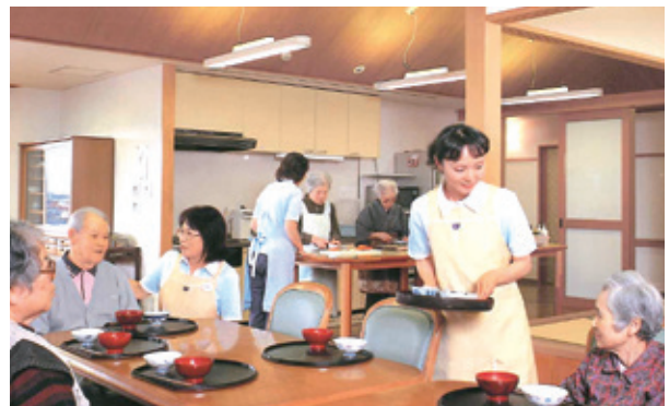
開設当初のパンフレットより