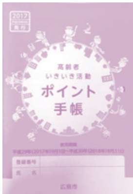
▲ポイント手帳です

※当日ポイント手帳をお忘れの場合、お名前を控えさせていただき、後日スタンプを押すことが出来ますので、遠慮なくお申し出ください。