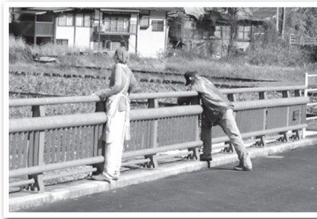
▲近所の人?いいえ、これもかかしです!

今年には紅葉には少し遅かったですが、かかしの里で楽しんだ後にはにぎや家に戻り、暖かい冬瓜汁と美味しい弁当を食べ皆さんとても満足された様子でした。