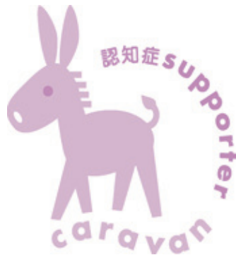
認知症サポーターキャラバン

認知症サポーターとは、認知症に対する正しい知識と理解を持ち、地域で認知症の人やその家族に対してできる範囲で手助けしたり、見守りをを行います。認知症サポーターになったからといって、「なにか」特別なことをしなければならないということはありません。認知症の人に偏見をもたず、認知症の人や家族を温かい目で見守ること、すなわち「応援者」なのです。