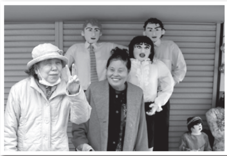
▲ブルゾンちえみ with Bと一緒に記念撮影