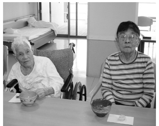
▲お茶と甘いお菓子がよく合うわね!!