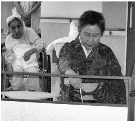
▲お茶席の雰囲気伝わってきます

五月十四日、B5病棟において金子先生とボランティアの方によるお茶席を開催致しました。毎年恒例になっている行事で、患者さまも前日より、「明日はお茶席よね? 嬉しいわ。」と楽しみにされており、お茶席の話題が尽きませんでした。 ホールに患者さま全員が集まり、畳、金屏風、掛け軸、お茶セットと用意され、雰囲気も十分に始まりました。茶道とは、一度きりしかない出会いのために、こころか