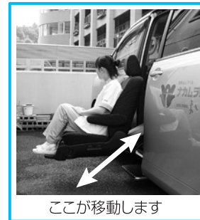
ここが移動します