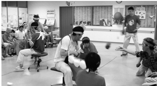
▲運動会にはご家族も参加され盛り上がります