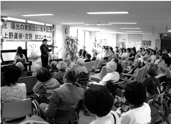
▲大勢の方でフロアがいっぱいです

発行所 〒731-5142 広島市佐伯区坪井三丁目818-1 TEL(082)923-8333(代) ホームページ http://www.pia-gr.or.jp/