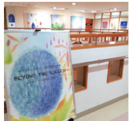
玄関ホール1つ上の階、ギャラリー2では色彩感覚あふれる立体作品の展示も