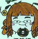
保健師 谷口 百合香